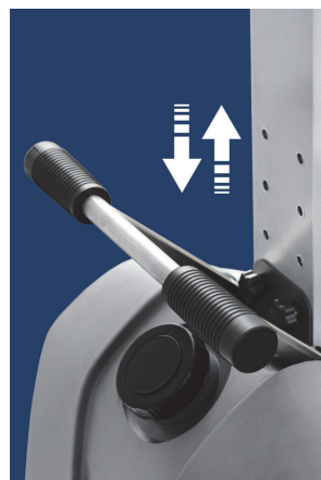
Adjustable height - Altezza regolabile