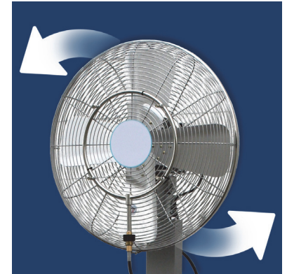
Oscillating fan - Ventilatore Oscillante